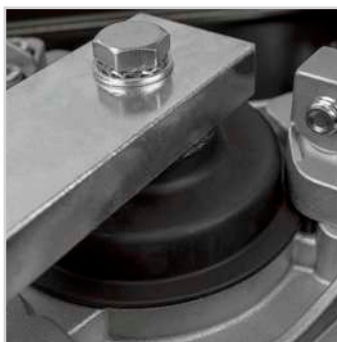
Waterdichte aluminium behuizing