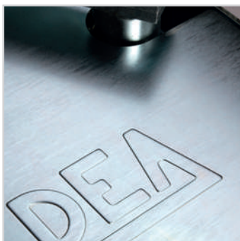
Fundatiekast beschikbaar in 2 versies, ofwel verzinkt of in Inox