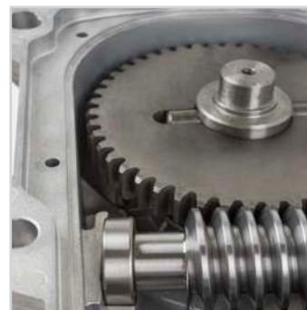
Langdurige intern metalen mechanisme met kogellagers